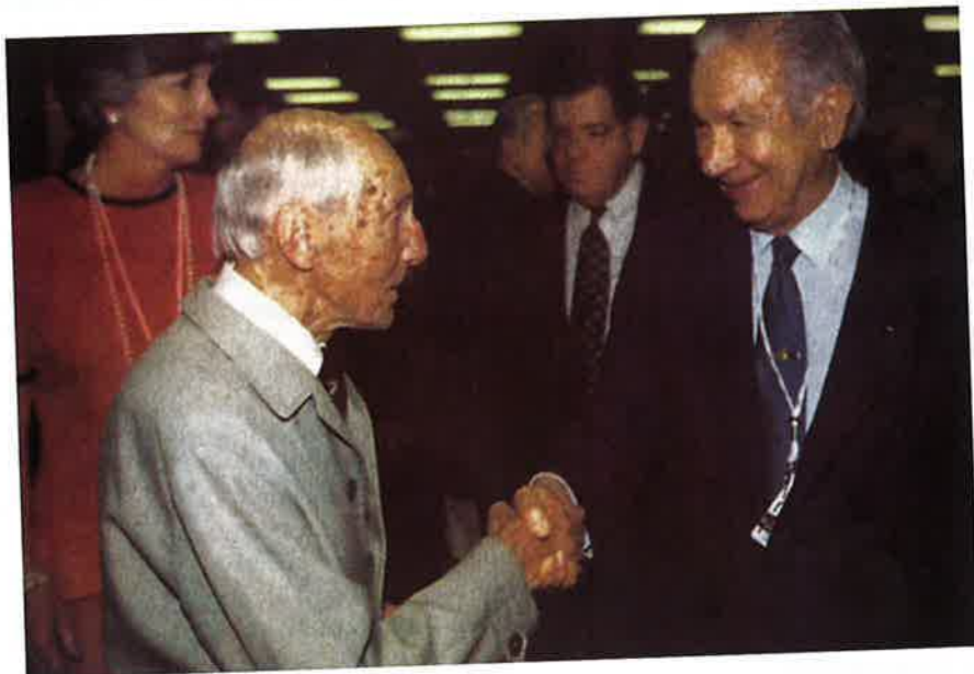
Leon Štukelj i J. A. Samaranch

Htio je poći i na Olimpijske igre u Sydney 2000. gdje bi bio istinska svjetska senzacija. Bio je to i u Atlanti 1996, tada sa 98 godina najstariji živući osvajač olimpijske medalje na svijetu. Sjećamo se kako se uspinjao na počasno postolje, živahan starčić niskog rasta, pomalo plešućeg koraka, s bijelom kapicom na glavi. Svi su ustali na noge da ga pozdrave, oduševljeno mu je pljeskao i predsjednik SAD Bill Clinton, također njegov veliki "fan". Kučan je tada Štukelja nazvao najboljim veleposlanikom Slovenije na svijetu. Već je tada, u Atlanti, počinjao slovenski ep o dugo vremena prešućivanom i zaboravljenom slavnom olimpijcu. Doživio je kulminaciju na